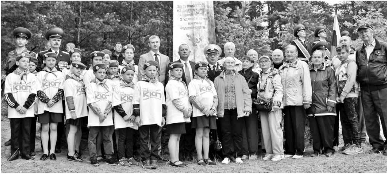
19 июля недалеко от г. Ивангород, на Федюнинском плацдарме, прошло торжественно-траурное мероприятие, посвященное 75-летию начала операции по освобождению Прибалтийских государств от немецко-фашистских захватчиков.

У памятника войнам, погибшим в 1944 году при форсировании реки Нарова, собрались ветераны, представители молодого поколения лагеря «Россонь», руководство города Ивангород, а также военнослужащие пограничных войск ФСБ Северо-Западного военного округа.